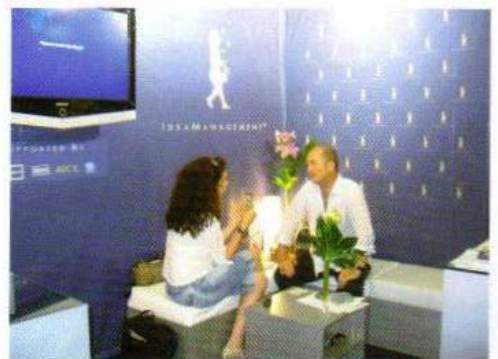
Das IdeaManagement Institut präsentiert neueste Erkenntnisse der Ideenwirkungsforschung beim International Advertising Festival in Cannes 2007.